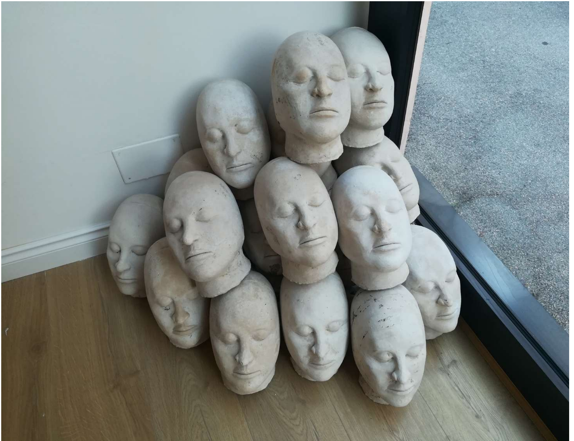
IMAGEN 5: Obra de Lang Ea