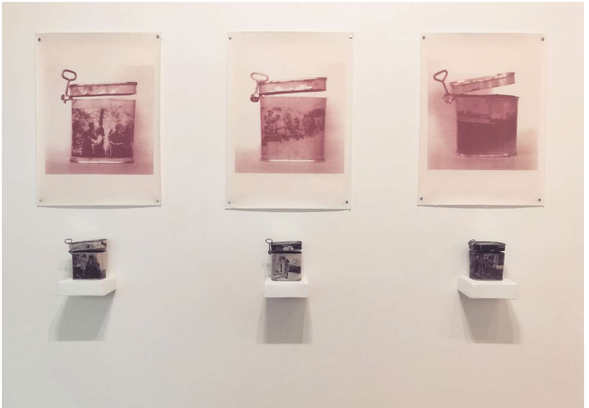
Imagen 2: Quello nella carne e conservato Vista General de latas y heliografías