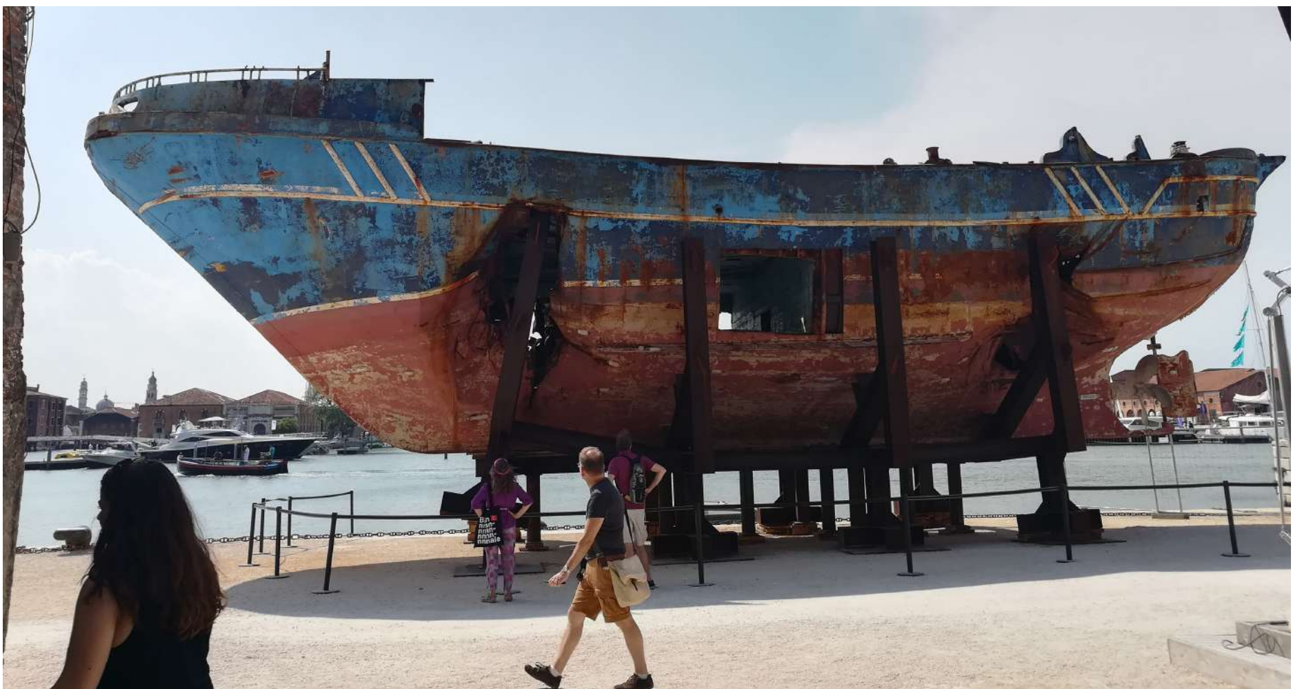
Imagen 1: Christoph Buchel Barca Nostra

Prof. Lenguaje Visual I, II y III - Diseño de Indumentaria / Facultad de Diseño y Comunicación UDE